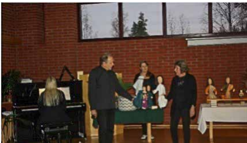
Nukketeatteri ILO esittää.