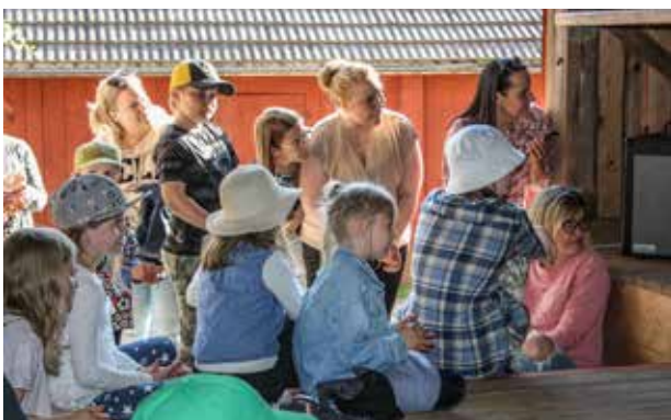
Oppilaiden esitykset kiinnostivat kovasti yleisöä.