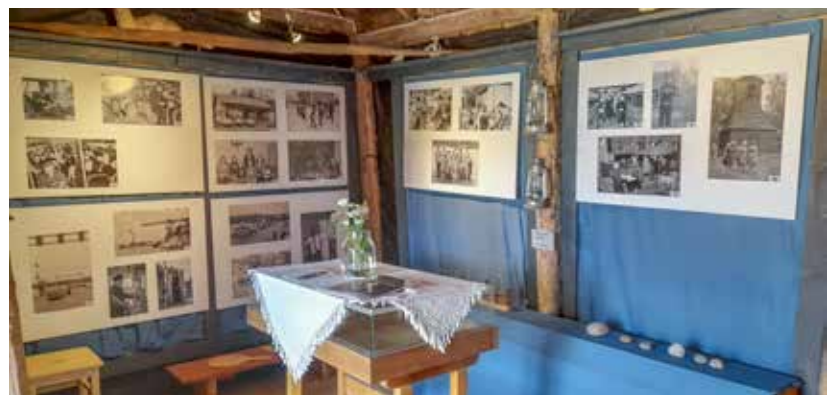
Kesän 2023 näyttely Kollolassa.