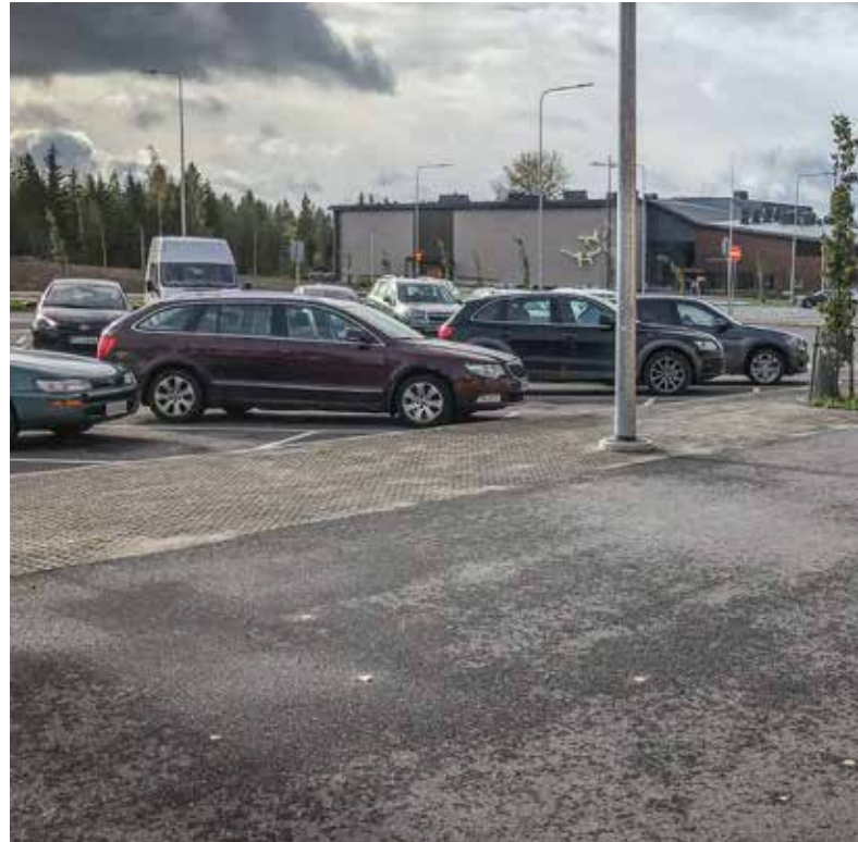
Metsän eliöyhteisö on tehokkaasti tapettu peittämällä se asfaltilla. Musta asfaltti ja suorastaa tukalaksi se muuttuu kuumina kesäpäivinä. Herää kysymys, ketä varten?

rakennusryhmien pienimuotoisuus ja meren ja sekä saarien luomat vaihtelevat maisemat.” Itsekin olen kiinnittänyt huomioita sisäsaariston maiseman pienipiirteisyyteen: täällä ei näe avomerta eikä siintävää horisonttia, mutta meri pilkahtaa usein yllättäen mutkan takaa tai metsän läpi, ja vesistö koostuu pienistä aukoista, kapeista sunteista, lahdenpoukamista ja ruokoharjasta. Pienet pellot ja peltosaarekkeet pylvaskatajineen, peltojen ja kallionnyppylöiden välitse pujottelevat kapeat tiet ja siellä täällä mäen päällä vuosisataiset talonpoikaisrakennukset hellivät silmää. Lähimaisemaan kuuluu toki myös sisäsaariston monipuolinen elonkirjo.