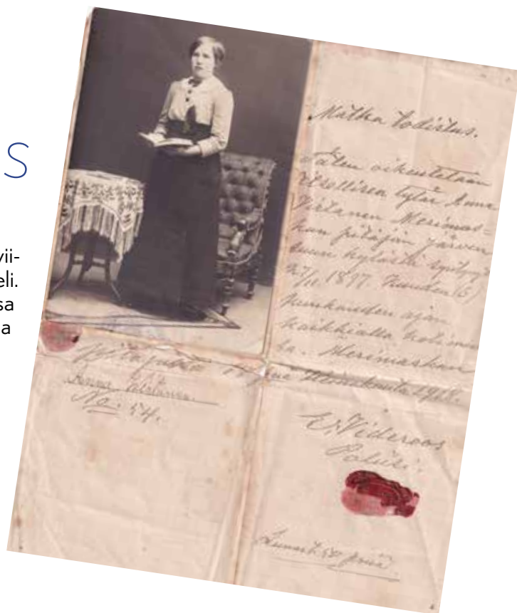
Kollolan Annan matkatodistus, jonka on myöntänyt heinäkuussa 1918 poliisi E. Videroos.