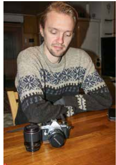
Mies ja filmikamera.