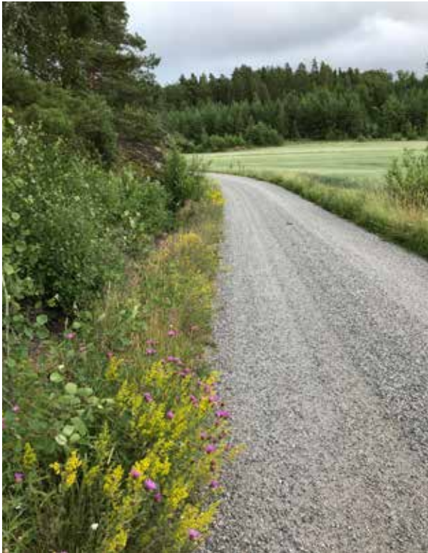
Kukkivat tien- ja pellonpientareet ovat osa kulttuuriympäristöä ja samalla viimeinen turvapaikka monille ketokasveille. Ne myös tarjoavat runsaan ruokapöydän pölyttäjille.