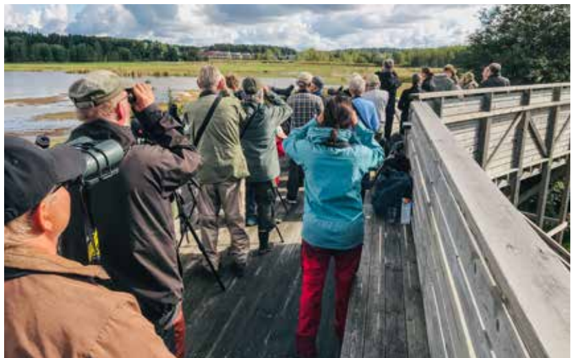
Lintuharrastus on Suomessa erittäin suosittua. Tässä seurataan syysmuuttoa Raisionlahden lintutornissa syksyllä 2023. Raisionlahdella havaittiin tuona päivänä mm. 15 muuttavaa mehiläishaukkaa, yksi tundrahammi, viiksitimaliparvi ja kymmeniä muita lajeja. Tiedot: tiira.fi