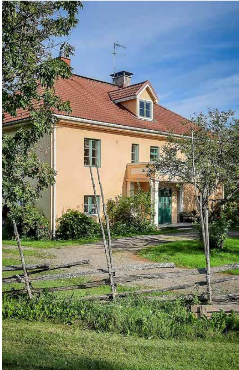
Aaholli.