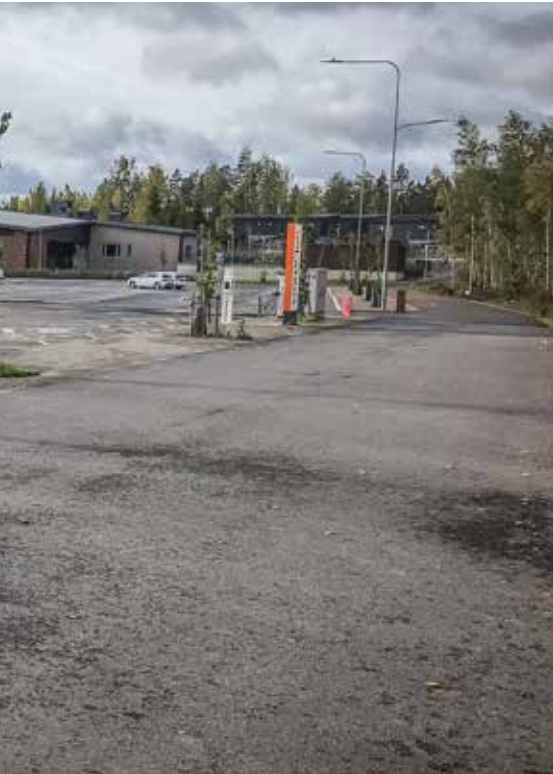
Asfalttikenttä ei ole myöskään ihmiselle viihtyisä ympäristö, jarten tällaisia asfalttikenttiä suunnitellaan.

monipuolisia eliöyhteisöjä sekä muita elonkirjon kannalta tärkeitä luonnon- ja kulttuuriympäristöjä.