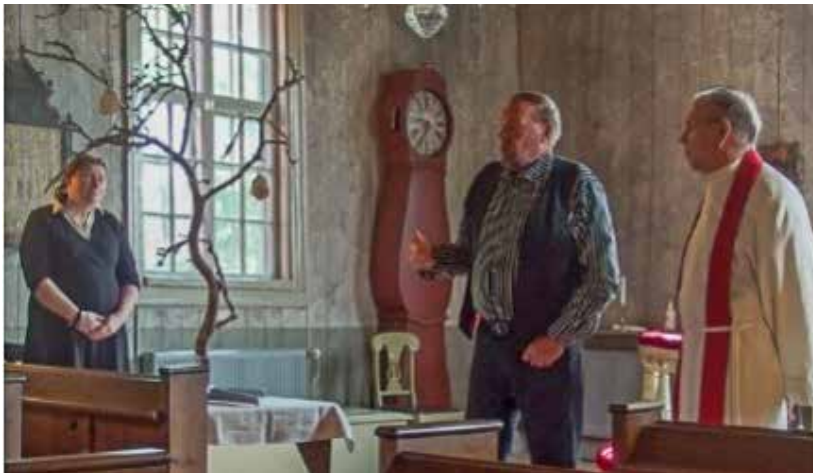
Kastepuun ideoi ja valmisti Reijo Ihalin.