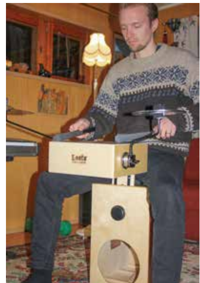
Mies ja loota.